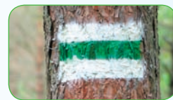
Ši trasa pažymėta taip